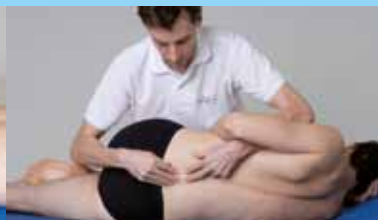
LBB Dg-WS L1-L5

Das neue SAMM-Handbuch Manuelle Medizin erscheint am diesjährigen Kongress als wissenschaftliches und praxisnahes Ausbildungs- und Nachschlagewerk . Es beinhaltet alle relevanten Therapie- und Behandlungstechniken in Bildstrecken und mit entsprechenden Kommentaren auf letztlich rund 500 Seiten.