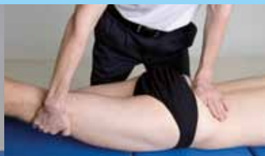
LBB Dg-WS LWS-Becken